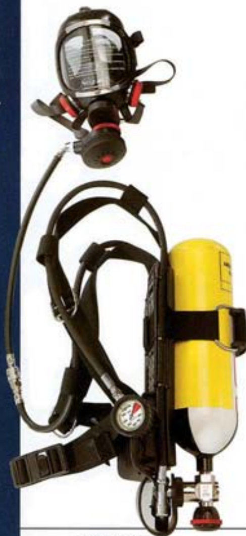
DIABLO PIZ Equipo autónomo de aire comprimido