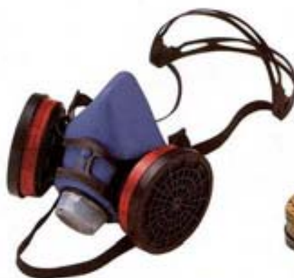
1001573 • WILLSON VALUAIR Polivalente, cómoda y ergonómica