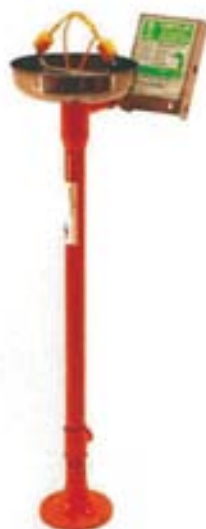
Lava ojos HI032