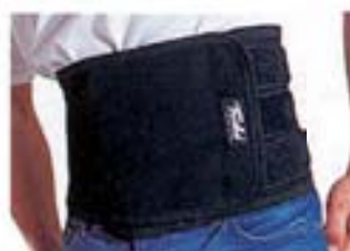
MOD. 800 • TURBO MASTER