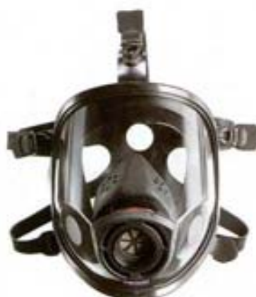
M3 Máscara antigas con conexión según Norma EN-148-1