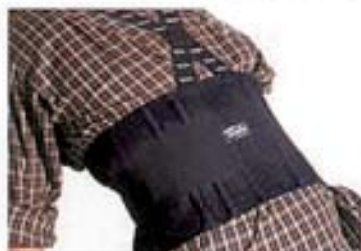
MOD. 836 • TURBO TRACK