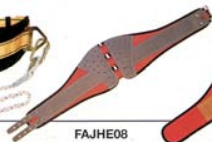
FAJHE08 Faja antivibración con hevilla