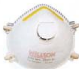
WILLSON SERIE 5000 Máscara respiratoria moldeado desechable