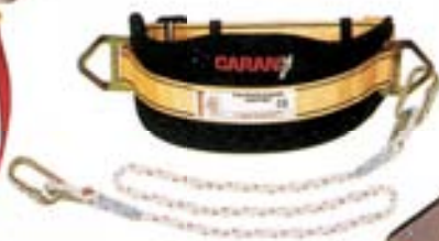
A011801 Cinturón de sujeción CR18