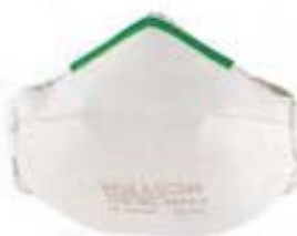
WILLSON SERIE 4000 Máscara respiratoria plegable en bolsa individual