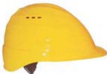
LP210V • TERANO

Pantalla protectora con diferentes filtros.