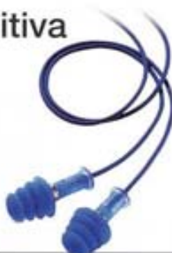
1011234 FUSION DETECTABLE