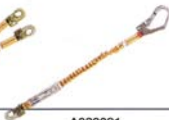
A033081 Elemento de amarre anticaídas 3008