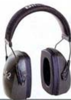
1010923 • LETGHTNINT

Orejera búfalo diseño dieléctrico. SNR: 30 dB