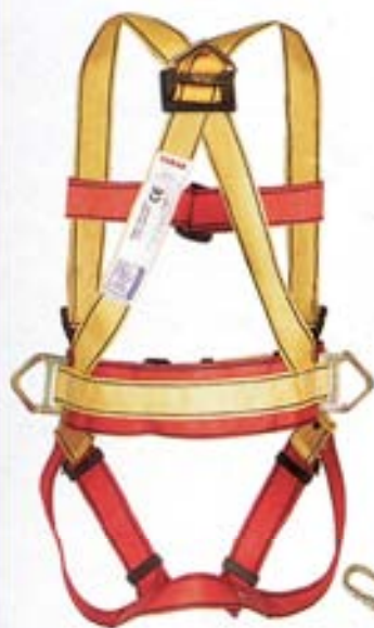
A010601 Arnés anticaídas CR07