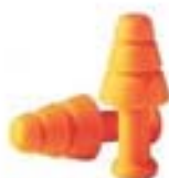
1011239 • SMART FIT