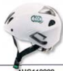
AHG110000 Casco abs con barbuquejo 3 puntos