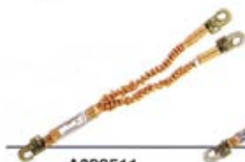
A033511 Elemento de amarre anticaídas 3001/2