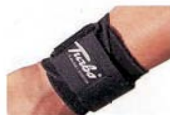
MOD. 849 • TURBO PLUS