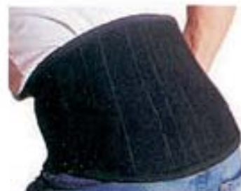
MOD. 825 • TURBO PLUS