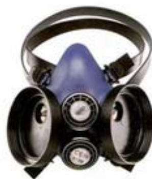
750 Mascarillas contra gases y partículas