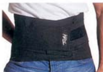
MOD. 835 • TURBO TRACK