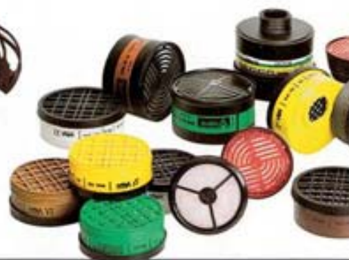
FILTROS El campo de aplicación dependerá del filtro adecuado