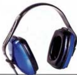
1010925 • VIKING