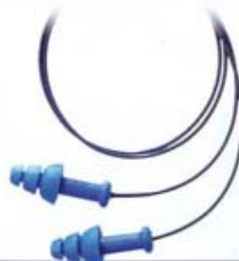
1012522 • SMART FIT